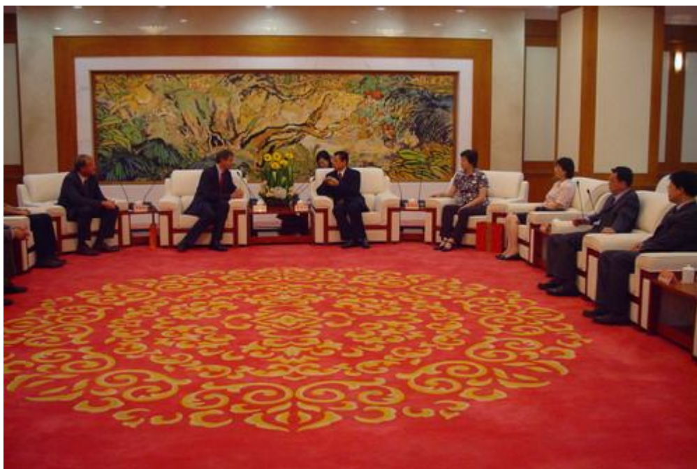
詹州副市长与马龙先生亲切交谈